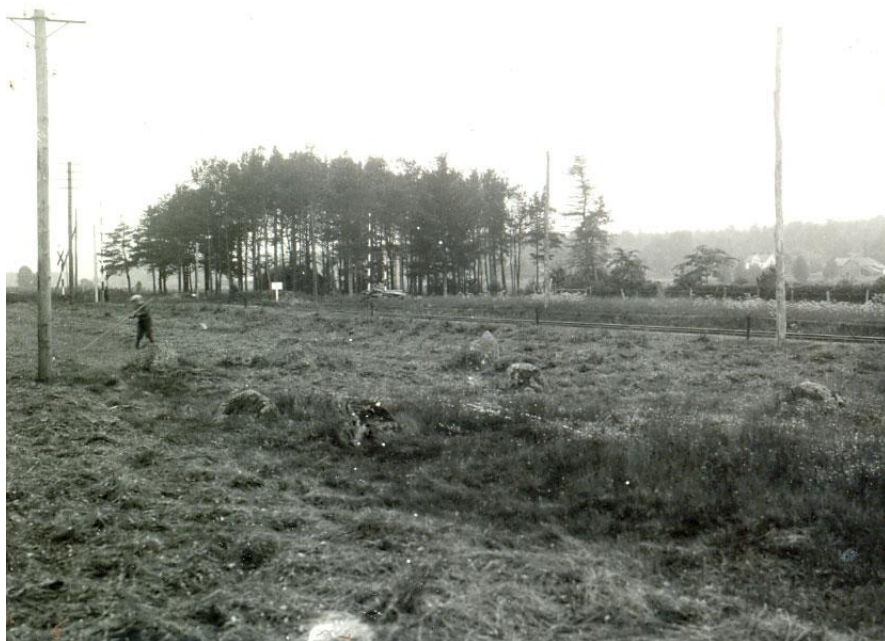
Foto från 1931 av G-A Hellman ur Inventering av fasta fornlämningar i Timmele socken. Från nordöst. Järnvägen syns i bakgrunden.