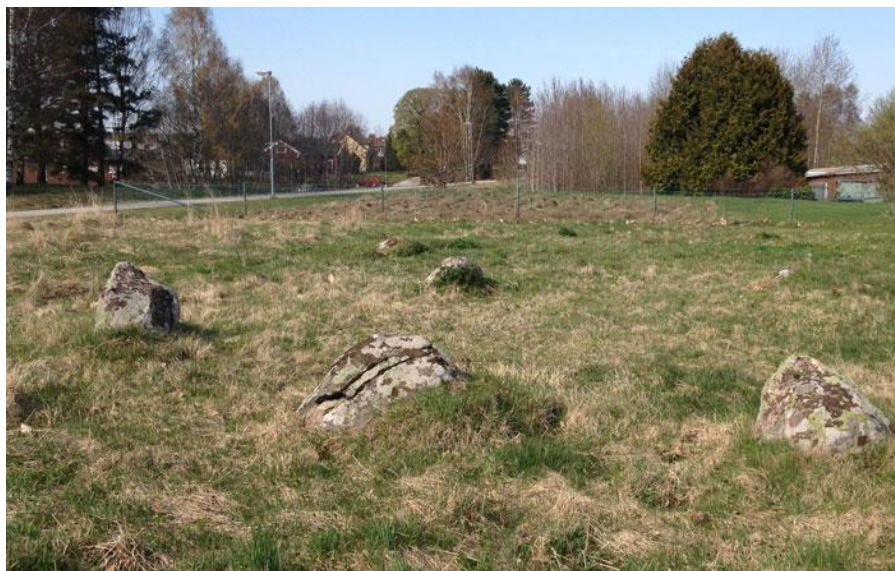
Tingsringen april 2014.

Domarringen är en gravmarkering från järnåldern. Den består av 5 resta klumpstenar som står i en cirkel. Det ser ut som om det ursprungligen har funnits 7 stenar i stenkretsen, men 2 har blivit flyttade/borttagna. Invid domarringen står ytterligare en rest klumpsten. Detta tyder på att det en gång fanns fler gravar på platsen, kanske till och med flera domarringar, vilket var vanligt under järnåldern.