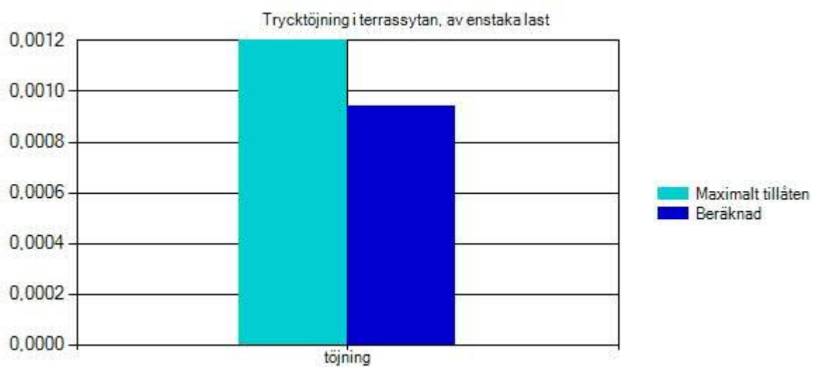
Trycktöjning i terrassyta, av enstaka last