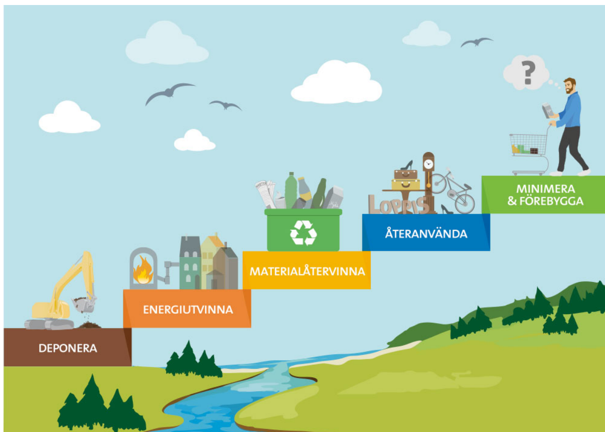
Bild 2 Avfallstrappan, Illustration Lidköpings kommun. Avfallstrappan styr hur avfallet ska tas om hand, i första hand ska vi minimera och förbygga att avfall uppstår genom medveten konsumtion. Om avfall uppstår ska det återanvändas och komma någon annan till del. Om återanvändning inte är möjligt ska materialet återvinnas. Om återvinning inte är möjligt ska energin utvinnas och i sista hand om inget alternativ kvarstår ska avfallet deponeras. Ovanstående bild illustrerar principerna i avfallstrappan.