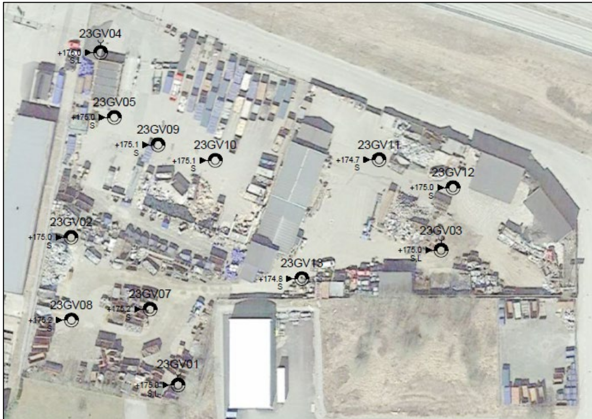
Figur 7. Provtagningspunkter, se även bilaga 1.

En övergripande bild av föroreningssituationen inom tomten skall ligga till grund för det framtida detaljplanarbetet samt inför kommande gräv- och schaktarbeten.