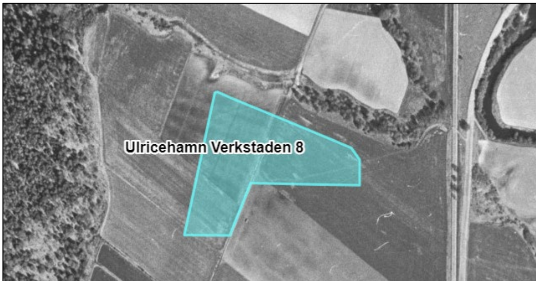
Figur 4. Flygbild ca 1960.

Området där aktuell fastighet ligger utgjordes tidigare av jordbruksmark, se figur 4.