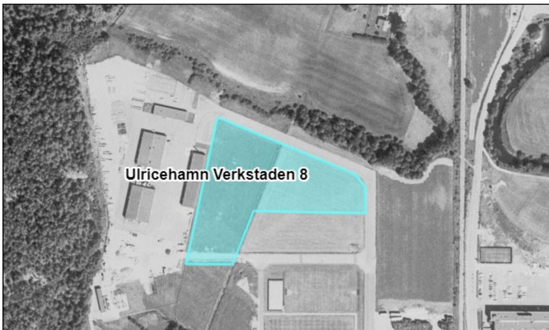
Figur 5. Flygbild ca 1975.

Fram till 1970-talet började industrier etablera sig i området, se figur 5.