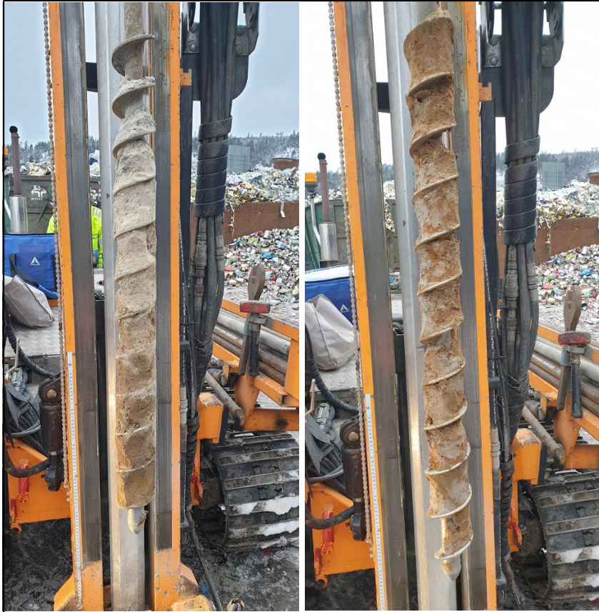
Figur 9. Provtagning i punkt 23GV12. Vänstra fotot visar provtagning 0-1 m under markytan och högra fotot visar 1-2 m under markytan.

Grundvattenytan bedömdes vid skruvprovtagningen till ca 0,8-2,3 m under markytan. Vid rensugning/tömning av rören var vattnet mycket slambemängt och tog slut efter ca 2-4 liter. Detta tolkas som att vattengenomsläppligheten är begränsad.