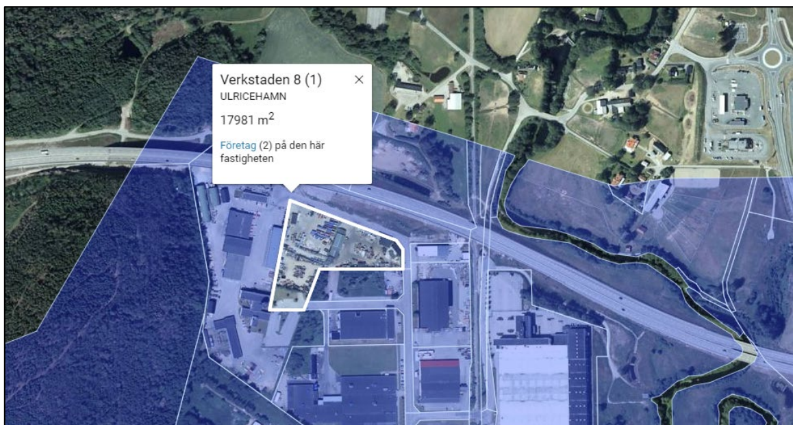
Figur 2. Flygbild över fastigheten.

Fastigheten ligger i Karlsnäs industriområde norr om Ulricehamns centrum och norr om sjön Åsunden. Fastigheten begränsas i norr och öster av Karlsnäsvägen och åt väster och söder av andra industrifastigheter. Norr om lokalvägen går Rv40, se figur 2.