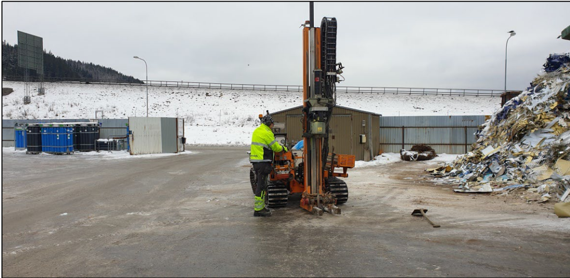
Figur 8. Provtagning med larvburen borrhandsvagn. Vy mot norr.

Sammanlagt insamlades 43 jordprover. Jordprover för analys med avseende på organiska kolväten och metaller förpackades i diffusionstäta plastpåsar.