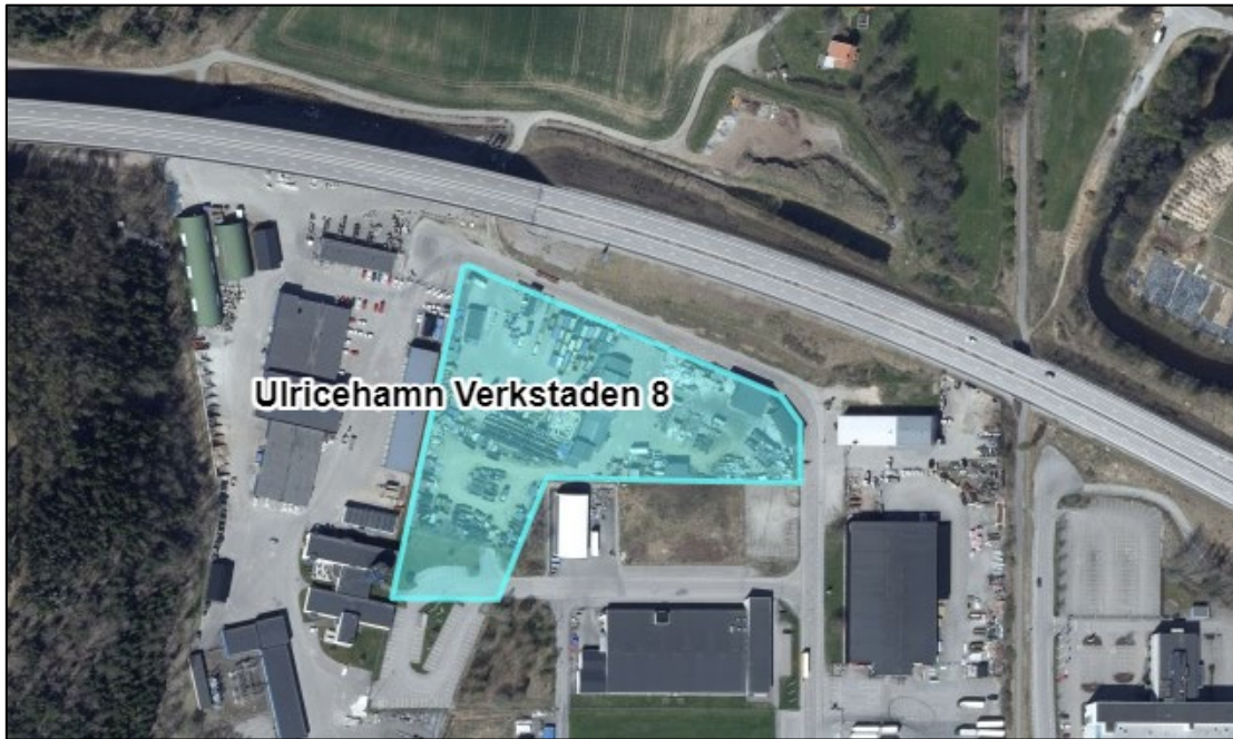
Figur 6. Flygbild 2023.

Inom verksamhetsområdet har materialhantering och upplag av skrot lokalt skett utan hårdgjorda ytor, vilka har identifierats som möjliga så kallade ”hot spots”. Dessa omfattar bl.a. undersökningspunkterna 23GV03 och 23GV07. En nedgrävd oljetank, som ej längre används, finns inom området öster om kontors- och verkstadsbyggnaden (undersökningspunkt 23GV06).